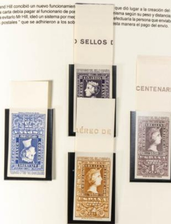
6 cuartos de 1850

que dio lugar a la creación del sello. Anteriormente, el envío según su peso y distancia, esto originaba muchos problemas para la persona que enviaba la carta, para ello, en esta manera el pago del envío.