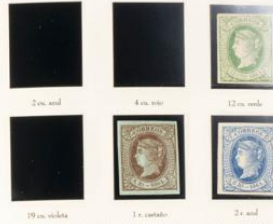
2 c. azul 4 c. negro 12 c. verde 19 c. violeta 1 c. castaño 2 c. azul

Según indica la legislación oficial esta serie se emitió en dos fechas, aproximándose primero al valor de 4 cuartos (1.1.1864) y posteriormente al valor de reales (1.3.1864). Se realizó en papel coloreado, distinto para cada valor de la emisión. Se conocen variedades de color, de papel y de impresión. Existen dos valores de la serie dentados: 4 cuartos (dentado: 13) y 2 cuartos (dentado: 14). Las marcas de identificación son las siguientes: las dos últimas letras de la dactiloma se encuentran casi pegadas. En las cuatro esquinas hay unas estrellas sombreadas, estrellas que no se encuentran en las falsificaciones. Como en la serie anterior al matasello más frecuente fue el de rueda de correo. También se utilizaron matasellos de espiga, parrilla, matasello de fecha y matasello ambulante.