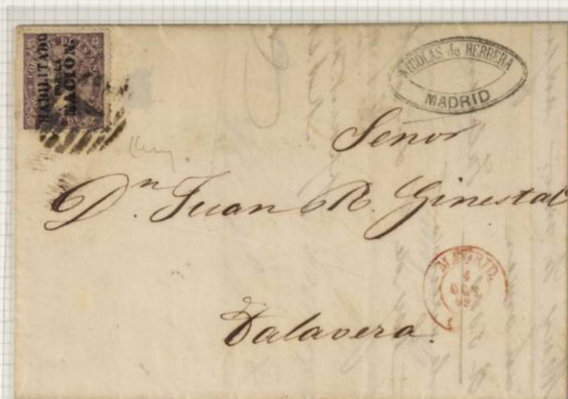
1869, Oct. 4, from Madrid to Tolvera. Arrival on back.