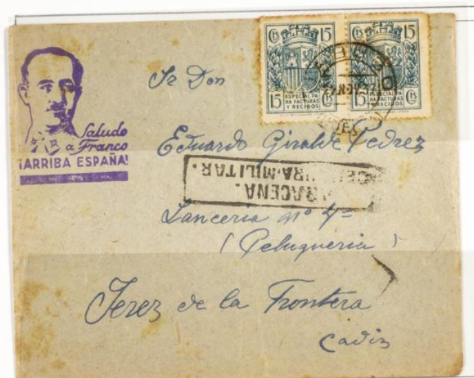
Carta circularada desde Sabiego Huelva a Jerez de la Frontera. Matasellos de salida de Sabiego con fecha 27 Noviembre 1937 y llegada al dorso ilegible. Censura militar de Taracena. Dos sellos fiscales especial facturas y recibos de 15 cts verde.

1937 - Timbre para facturas. Escudo con corona mural. Impresos en Litografía. Pie de imprenta "HIJOS DE H. FOURNIER VITORIA." Dentado 10 ¼ - 11 ½.