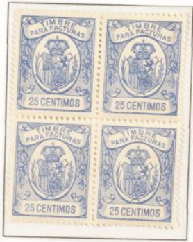
Dentado 11 ½