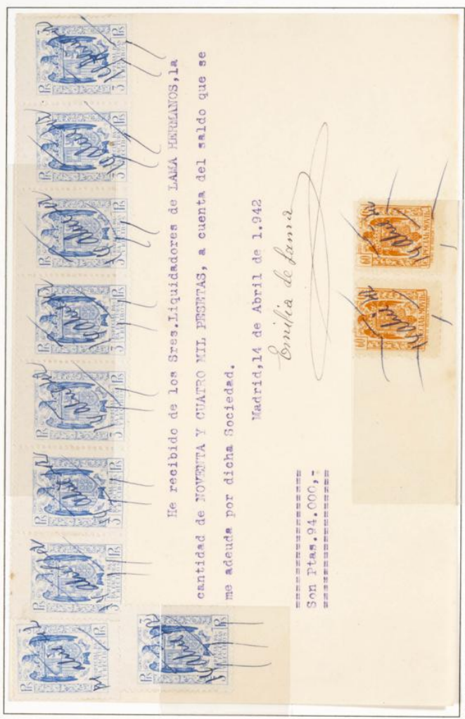
Recibo de fecha 14 de Abril de 1942, por importe de 94.000 Ptas con 9 Especial para Facturas y recibos de 3 Ptas color Azul, dos especiales móviles con pie de imprenta de 60 cts.

1939.- Timbre para facturas y recibos. Escudo Nacional. Impresos en litografía. Dentado 10 1/2 en peine.