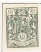
Tonalidades de color