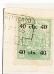
Fragmento matasellado en Avila Diciembre 1936