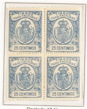
Dentado 13 ½

Se llo para facturas y recibos. Corona Real en un óvalo. Leyenda Timbre para facturas en la parte superior y valor en la inferior. En los laterales corona de laureles. en rojo. Dentado 13 ½