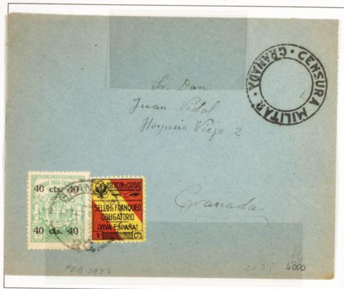
Sobre circularo correo interior de Granada. Matasellos de Granada de fecha Febrero 1937. Censura militar de Granada.

1937.- Timbre Móviles (Pólizas) para facturas. Impresos en Litografía sin valor. Valor sobrecargado en negro en las cuatro esquinas. Dentado 11 ½.