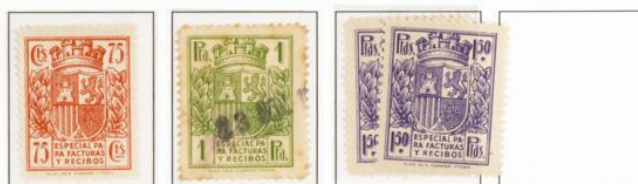
Cambios en las tonalidades de color