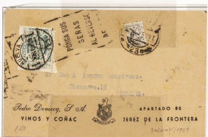
Carta circulada desde Jerez de la Frontera a Huelva con fecha de salida 30 de Noviembre de 1959. Contiene sello Especial para Facturas 15 cts. Verde y sello de la Mutualidad Postal. Matasellos publicitario.

1939.- Timbre para facturas. Escudo nacional. Impresos en Litografía. Dentado 10 ½ en peine.