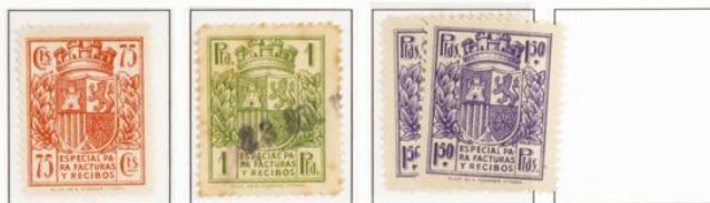
Cambios en las tonalidades de color