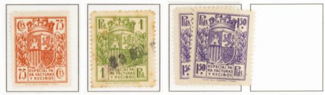
Cambios en las tonalidades de color