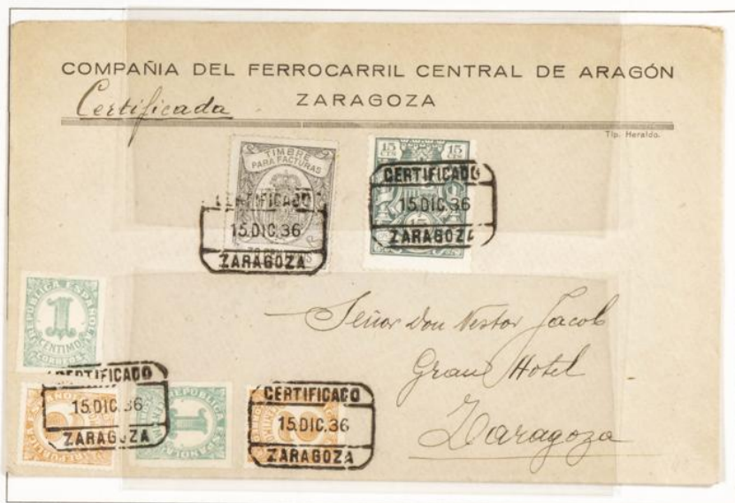
Sobre certificado circulado correo interior Zaragoza. Matasellos de salida Zaragoza fechado el 15 Diciembre 1936. Timbre para facturas negro 30 cts y 15 cts verde especial para facturas y recibos

1920 -1936.- Timbre para facturas. Escudo con Corona Real . Numeración en el reverso. Dentado 13 1/2. De peine.