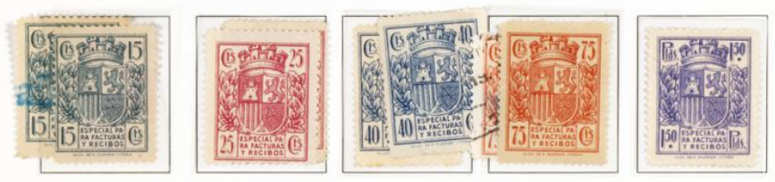
Fragmento utilizado por Correo