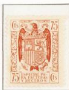
No catalogado 11 \frac{3}{4}