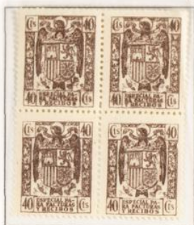
Impresión borrosa 11 \frac{1}{4}