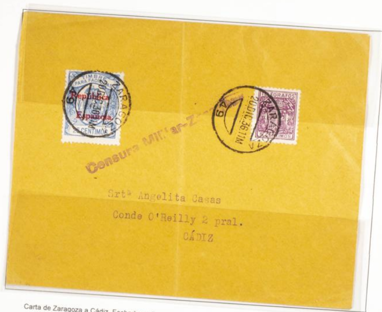
Carta de Zaragoza a Cádiz. Fechada en Zaragoza el 20 Diciembre 1936. Censura militar de Zaragoza. Póliza de 25 Cts sobrecargada República Española en Rojo. Sello de telégrafos 5 cts violeta.

1920 -1936.- Timbre para facturas. Escudo con Corona Real . Sobrecarga República Española con estampilla de caucho. Numeración en el reverso. Dentado 13 1/2. De peine.