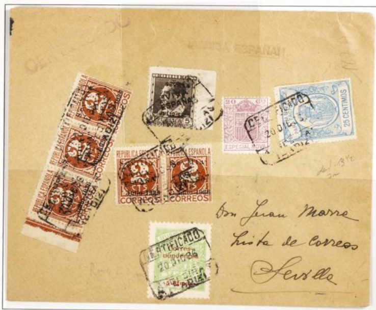
Carta circularizada desde Algeciras a Sevilla con fecha de salida 20 de Diciembre de 1939. Contiene sello Timbre para Facturas 25 cts. Azul dent. 14 y sello especial móvil de 20 cts. Además sellos patrióticos de Sevilla.

1939. - Timbre para facturas. Escudo con corona real. Dentado 14. Dentado 10 ½ en peine.