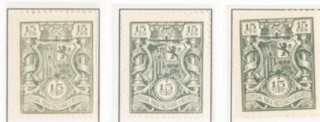
Tonalidades de color