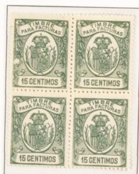
Dentado 11 ½