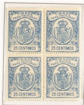
Dentado 13 ½

Se llo para facturas y recibos. Corona Real en un óvalo. Leyenda Timbre para facturas en la parte superior y valor en la inferior. En los laterales corona de laureles. en rojo. Dentado 13 ½