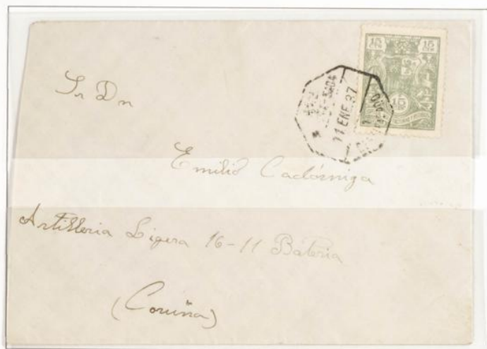
Carta de Lugo a Coruña correo Certificado. Salida el 11 de Enero 1937. Sellos especial para Facturas y Recibos 15 cts verde claro.

1932-1936.- Timbre para facturas. Escudo con corona mural. Impreso en Litografía con numeración azul o negra en el reverso. Dentado 11 1/2.