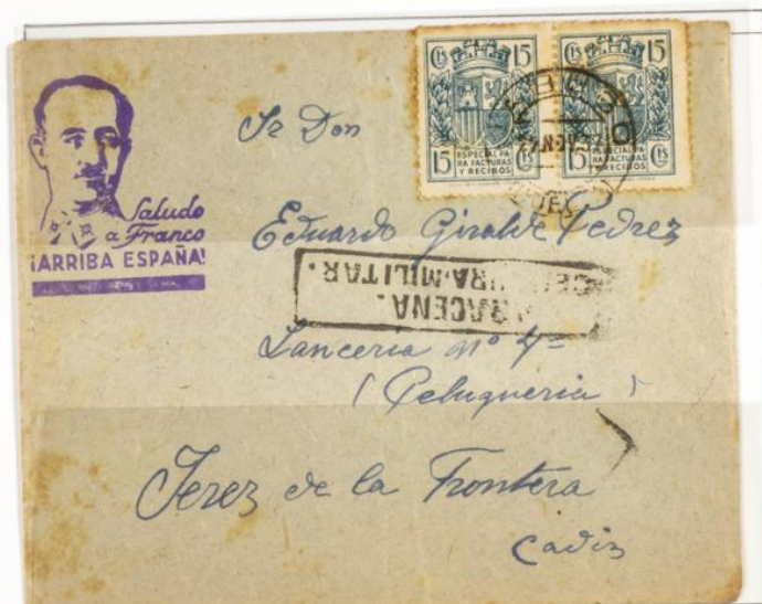
Carta circularada desde Sabiego Huelva a Jerez de la Frontera. Matasellos de salida de Sabiego con fecha 27 Noviembre 1937 y llegada al dorso ilegible. Censura militar de Taracena. Dos sellos fiscales especial facturas y recibos de 15 cts verde.

1937 - Timbre para facturas. Escudo con corona mural. Impresos en Litografía. Pie de imprenta " HIJOS DE H. FOURNIER VITORIA." Dentado 10 ¼ - 11 ½.