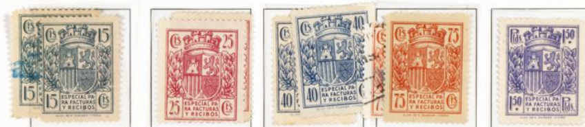
Fragmento utilizado por Correo