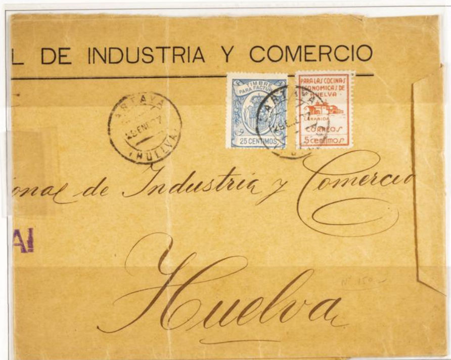
Sobre circulado correo interior Huelva. Matasellos de salida Cartaya - Huelva fechado el 29 de Enero 1937. Póliza de 25 cts azul y Benéfico de Huelva

1920 -1936 - Timbre para facturas. Escudo con Corona Real . Numeración en el reverso. Dentado 13 1/2. De peine.