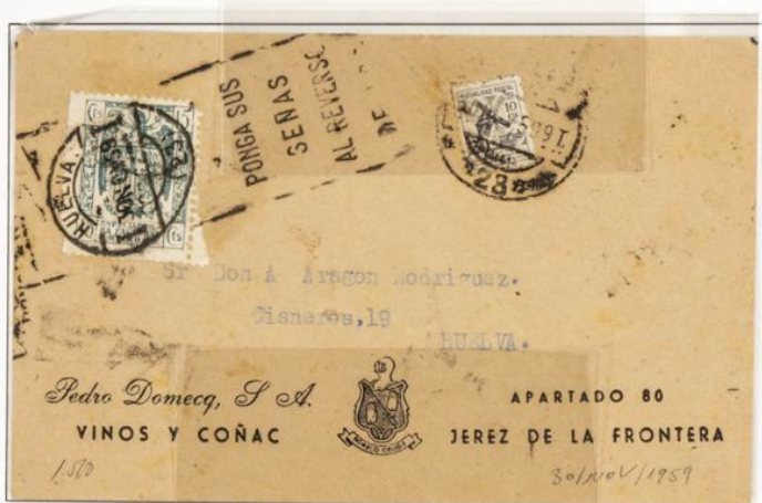
Carta circulada desde Jerez de la Frontera a Huelva con fecha de salida 30 de Noviembre de 1959. Contiene sello Especial para Facturas 15 cts. Verde y sello de la Mutualidad Postal. Matasellos publicitario.

1939.- Timbre para facturas. Escudo nacional. Impresos en Litografía. Dentado 10 ½ en peine.