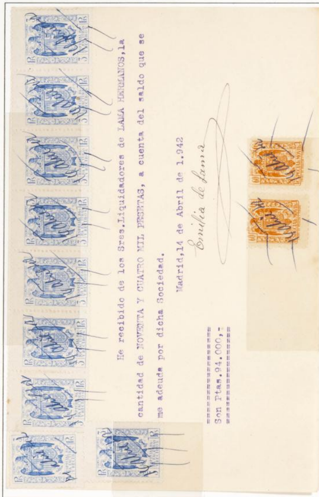
Recibo de fecha 14 de Abril de 1942, por importe de 94.000 Ptas con 9 Especial para Facturas y recibos de 3 Ptas color Azul, dos especiales móviles con pie de imprenta de 60 cts.

1939.- Timbre para facturas y recibos. Escudo Nacional. Impresos en litografía. Dentado 10 1/2 en peine.