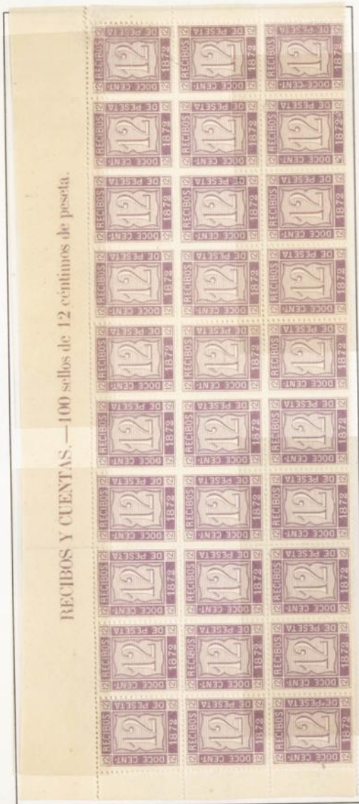
Bloque de treinta con bandeleta.

RECIBOS Y CUENTAS.—100 sellos de 12 centimos de peseta.