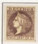
Cambios de color

1º de Enero 1867 hasta 1 de Enero 1868 Busto de la Reina Isabel. Lema en el cartucho superior "Recibos" y Sets en el cartucho inferior. Grabador José Pérez Varela. Dentado 14.