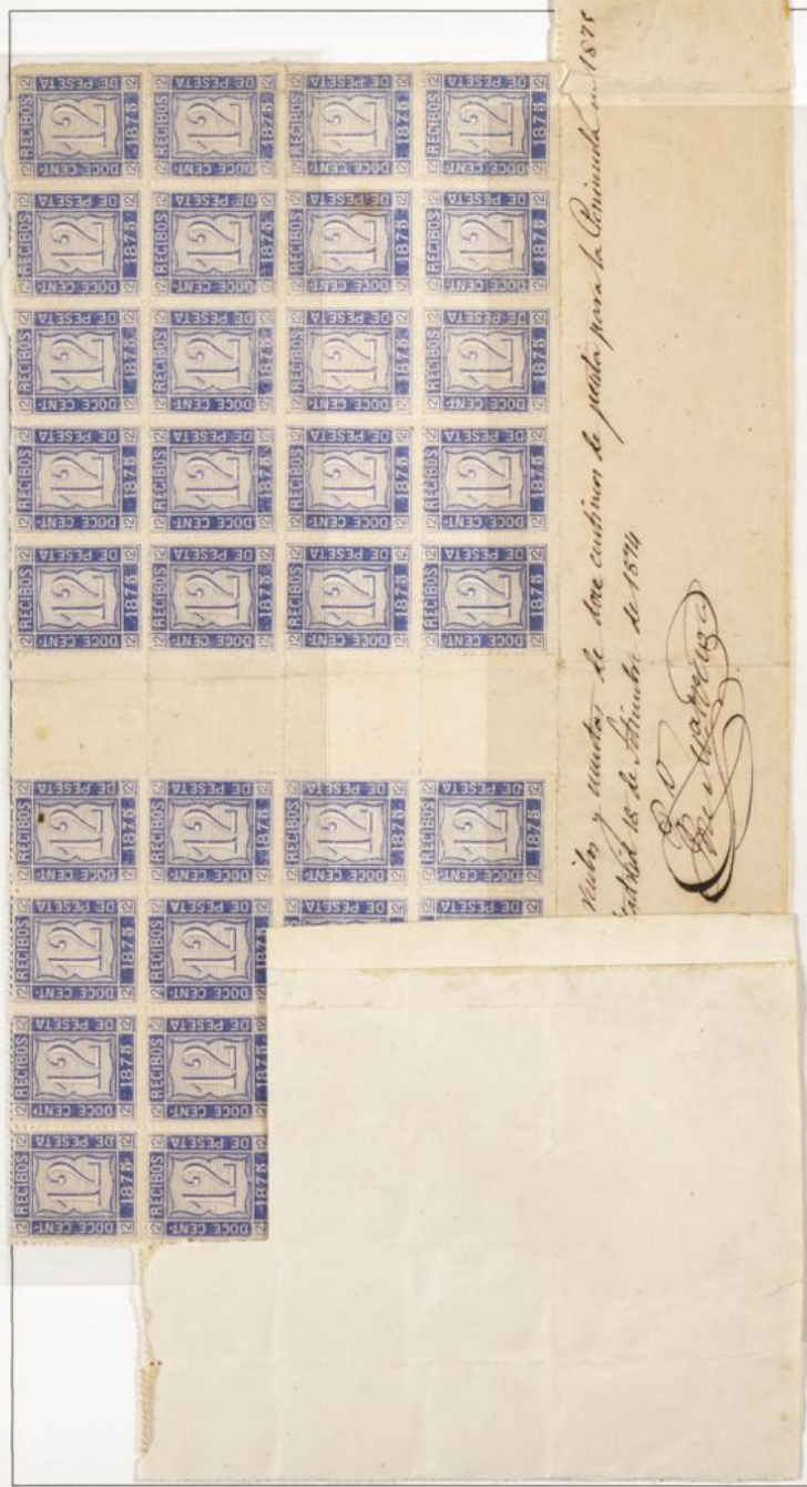
Muestra de tintas para los sellos y cuentas de doce céntimos de peseta para la Península en 1875.

Cifra de valor llena el rectángulo central y las cuatro caras que rodean dicha cifra están ocupadas por las palabras doce recibos milésimas 1872, 73, 74, 75. En los ángulos las palabras DOCE CENT.