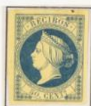
Variedades de color y de papel, amarillento hasta blanco.

1º de Enero 1861 hasta 1 de Enero 1866 Busto de la Reina Isabel. Lema en la parte superior "Recibos" y 50cts en el cartucho inferior. Grabador José Pérez Varela. Sin Dentar.