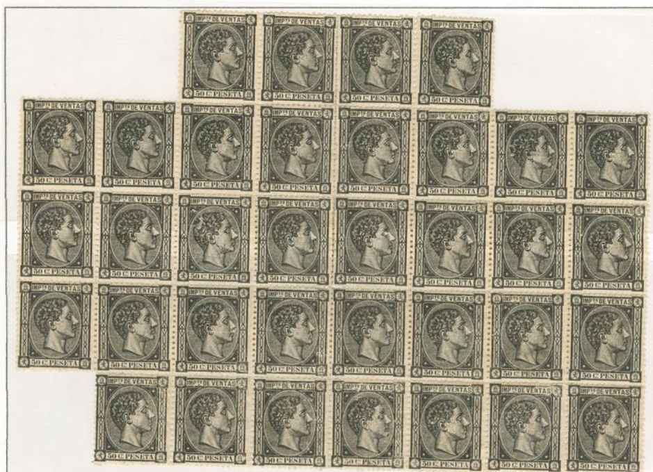
Bloque de 35 sellos.

1º de Febrero 1877 hasta 11 de Junio de 1877. Efigie de Alfonso XII conteniendo inscripciones Imptº ventas en la parte superior y valor en la inferior. Grabador Eugenio Juliá. Dent. 14.