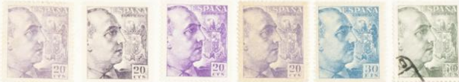
Dentado 13 de línea