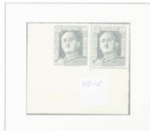
90 centimos verde, pareja. Un sello dentado y otro sin dentar, producido por desplazamiento del parne hacia la derecha.