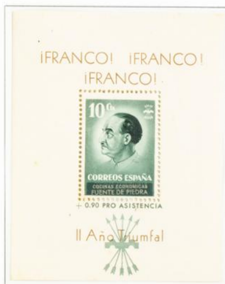
Hojita bloque benéfica local de Fuente de Piedra con un diseño que nunca se utilizó en sellos, quizás por la tosquedad del dibujo.