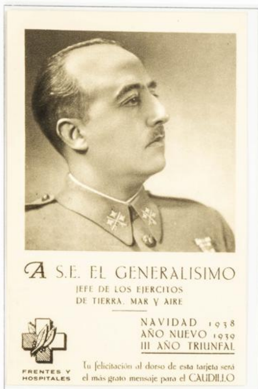
Tarjeta Postal de Frentes y Hospitales cuyo diseño sirvió de base para el sello.