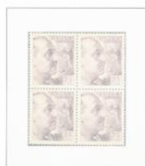
25 centimos castaño lila oscuro, bloque de cuatro. Valor complementario emitido en 1950.