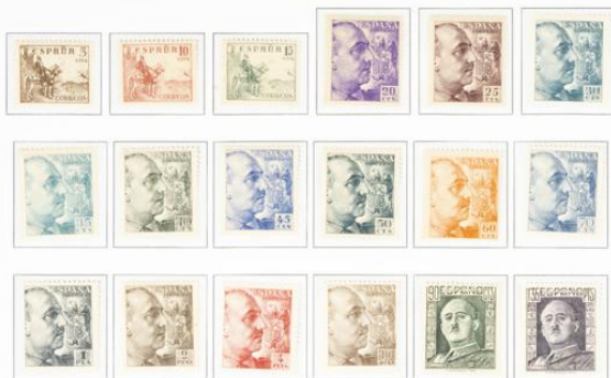
Serie completa de dieciocho valores, tres con imagen del Cid, tres con dibujo de Sancho. Toda y dos con dibujo de Camilo Dablos. Emitida como renovación de la serie básica con dentado 12N x 13½ (también llamada serie de dentado fino).