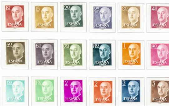
Serie completa de veinticuatro valores, emitida como renovación de la serie básica para circular a partir de 1955.