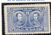
Simón Bolívar y A. J. de Sucre