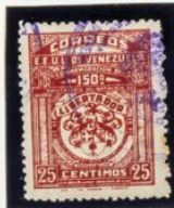
Entrada de Bolívar