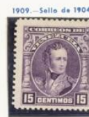
Antonio José de Sucre