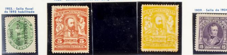
1903.- Sello fiscal de 1893 habilitado