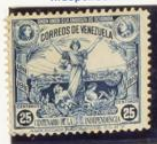
Vista de Caracas y Libertad