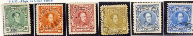
1915-23.—Efigie de Simón Bolívar