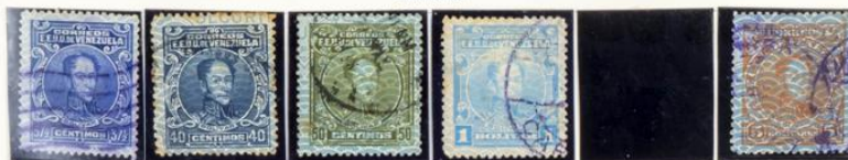
1933-36.—Sellos de 1924-32 habilitados con 1933 y nuevo valor