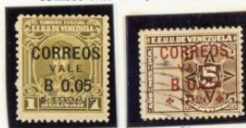
Antonio José de Sucre