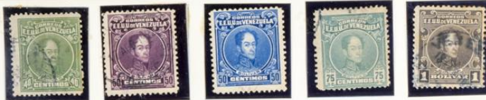
1924-28.—Sellos de 1915-23 con los colores cambiados