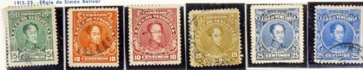
1915-23.—Efigie de Simón Bolívar