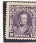
Antonio José de Sucre