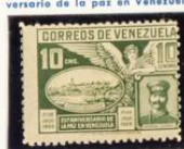
General Gómez y vista de Ciudad Bolívar