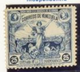
Visto de Corcos y Libertad