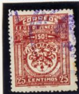
Entrada de Bolívar