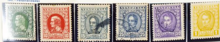
Francisco de Miranda