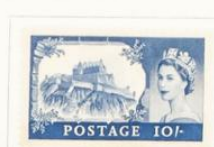
Castillo de Edimburgo