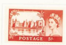
Castillo de Carnarvon