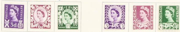
Gales y Monmouthshire

1958.—Isabel II y símbolos de cada región