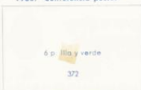
Isabel II y alegorías