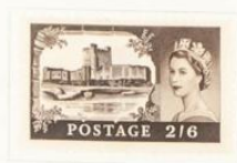
Castillo de Carrickfergus