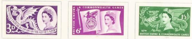
Isabel II y dragones simbólicos de Escocia

1958.—6.º Juegos deportivos del Imperio británico