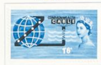
Isabel II, esfera y cable