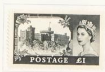
Castillo de Windsor

1958-59.—Sellos precedentes con una o dos barras negras verticales en el dorso