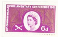
Arco Interior de Westminster