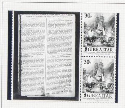
Batalla de Trafalgar, 1805

2001. Bicentenario del diario «Gibraltar Chronicle». Sellos alusivos a acontecimientos importantes y viñetas de las primeras páginas de los números de esos días