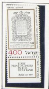
1977. Cuarto centenario del primer periódico israelí impreso en Tierra Santa