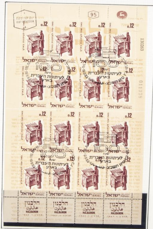
Miniplego con 16 sellos, todos diferentes, con las leyendas del fondo alusivas al centenario que se conmemora, con matasellos del primer día de emisión (19 de junio de 1963) y ejemplar sin matasellar.