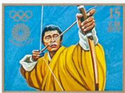
BHUTAN • འབྲུག་