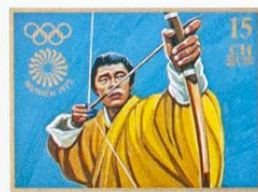
BHUTAN • འབྲུག་