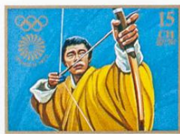
BHUTAN • འབྲུག་