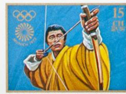
BHUTAN • འབྲུག་