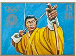
BHUTAN • འབྲུག་