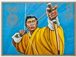
BHUTAN • འབྲུག་