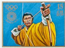
BHUTAN • འབྲུག་