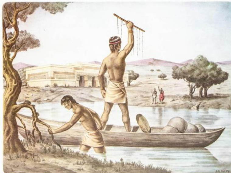
Portador de «gripos» en Mexico, 1590, por Balbuena.

Depósito legal: M. 9.783-1958 - ISSN: 0210-2.803