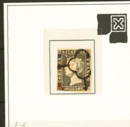
I-6 Raya Defecto de impresión. Mancha blanca entre el marco y la roseta superior derecha