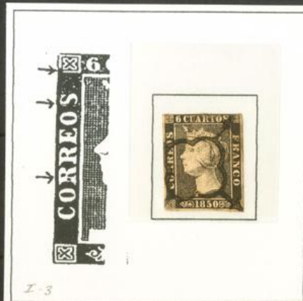
I-3 Variedad número 19. Punto negro en roseta superior izquierda. Raya negra en "S" de "correos".