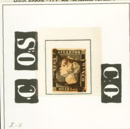
I-5 Defecto de impresión. Mancha blanca a los lados de la "C" de "correos". Manchas blancas entre "O" y "S" de "correos". Manchas blancas entre "C" y "O" de "franco". Deformación de "O" de "franco".