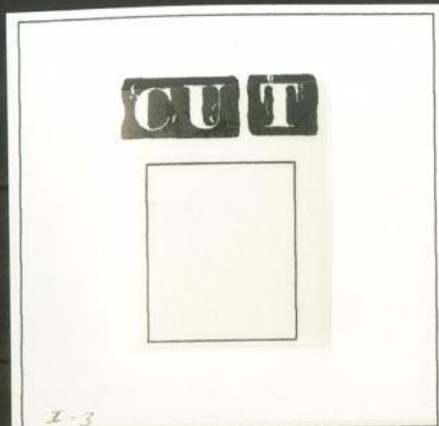
I-3 Defecto de impresión. Manchas blancas alrededor de "CU" y "T" de "cuarto"

º 1(39). 1850. Conjunto de treinta y nueve sellos del 6 cuartos negro (Plancha I) con diversas variedades de cliché o características de cada tipo, algunos repetidos y sólo faltarían los tipos 1, 2, 4, 21 y 22 para la plancha completa. MAGNIFICO Y ESPECTACULAR CONJUNTO.