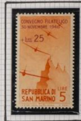
A 52 B