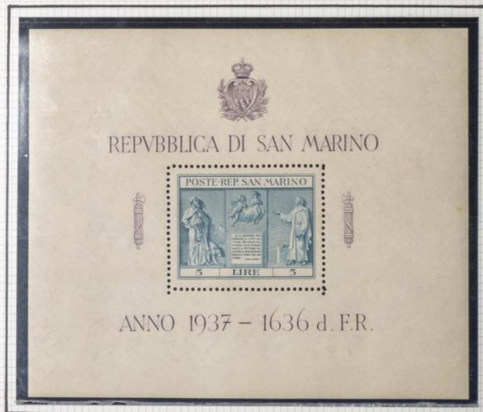
HOJA Nº 1