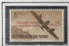
A 52 A