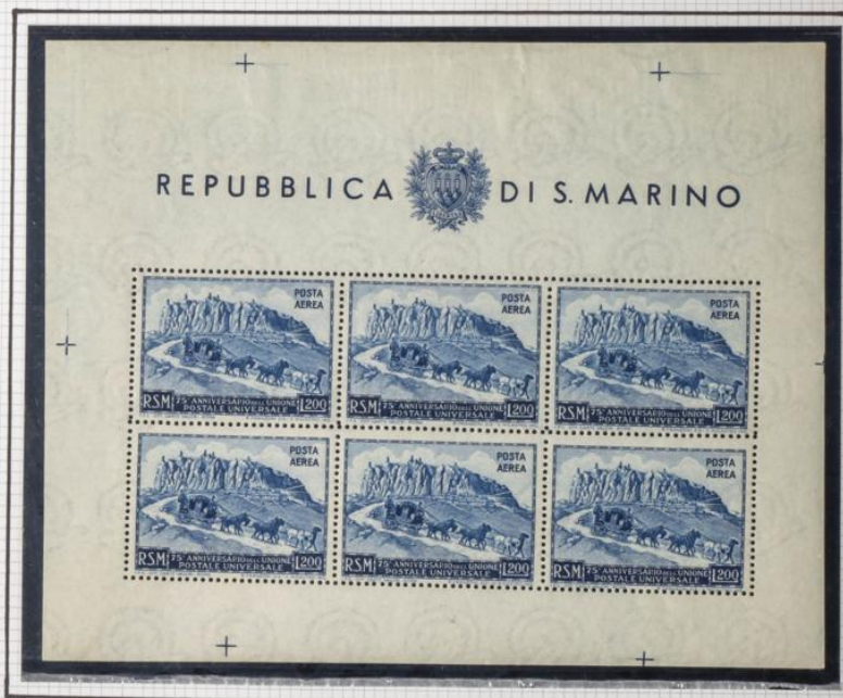
HOJA Nº 5