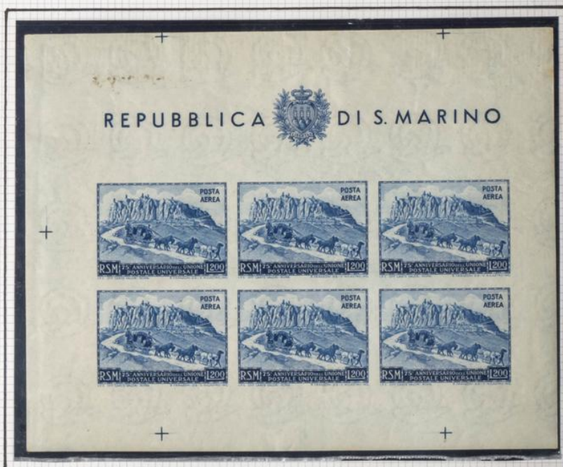
HOJA N° 5