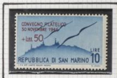
A 52 C