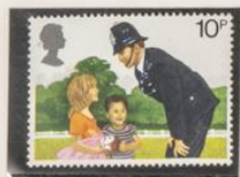
1979 - POLICIA