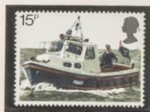
1979 - SERIE CORRIENTE