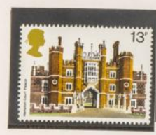
1978 - EXPOSICION FILATELICA «LONDON 1980»