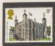
1978 - PALACIOS Y CASTILLOS