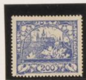
D. 13'75 x 13'5 40