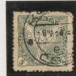
Dent. 11's (Verde)