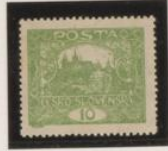
D. 13'75 x 13'5 31