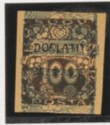
Sobre 2 h. (n o 1) periódicas