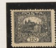
D. 11'5 39