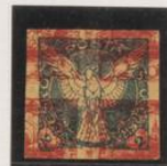
1/2 oscuro sobre 10h (n°5) doble impresion