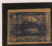
Triple impresión: azul gris y azul