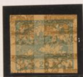
20h sobre 30h (n° 12)