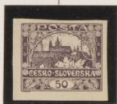
Rotura entre "0" y "5"