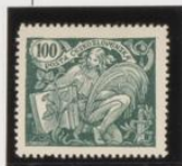
Marco Verde oscuro