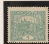
D. 13'75 Marco roto