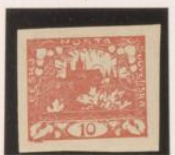
Sin marco exterior Adornos entintados "S" nota