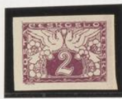
Estofado marco interior