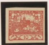
Sin marco Adornos entintados