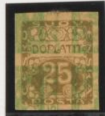
Sobre doble impresión del 5 h. (n o 3)