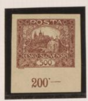
Borde inferior de hoja Punto sobre '5' y óvalo.