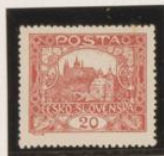
D. 13'75 x 13'5 34