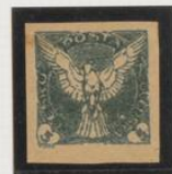
Doble impresión, con verde claro