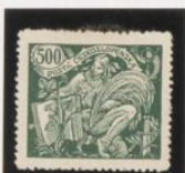
Marco Verde oscuro