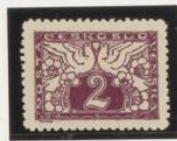
Dent. 11,25x11,5 No catalog.