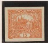
"1" (15) falta pie largo. Cabeza del "5" (15) curva