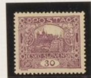
D. 11'75 37