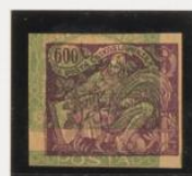
Rosa-lila s/106 (m:6)