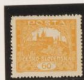
D. 13'75 x 13'5 38