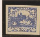
Doble marco y entintado Doble s.o.