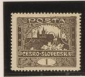
Doble marco esquina deha.