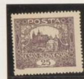
D. 13'75 x 13'5 36