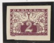
"L" en vez de "K"