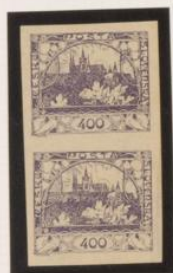
Fra "N", roto