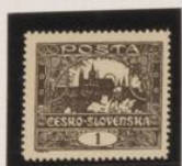
D. def. 13'75 27