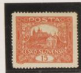
D. 13'75 32