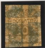
Bajo el 2 h. (n o 1) periódicas