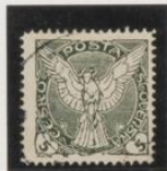
Verde-negro dent. 11's