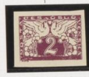
Falta "K", Marco inf. estofado