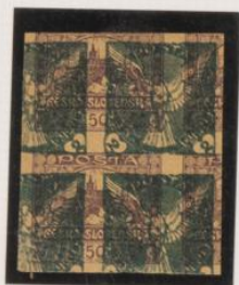
Doble impresion, sobre 50h (n°)