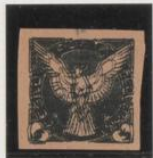
Triple impresión s/rosa