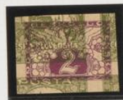
Sobre 80h. (n.º 9)