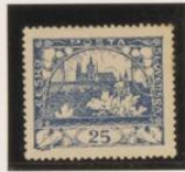
D. 13'75 x 13'5 35