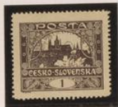
Sallo de peise