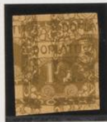
Sobre 5 h. (n o 1)