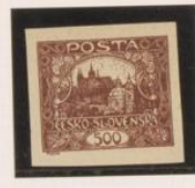
5ª parte al óvalo