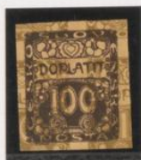
Sobre 10 h.