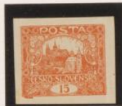
"5" (15), paloventral fijo