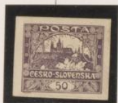
Línea completa sobre "0"