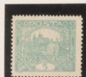
D. 13'15 x 11'5