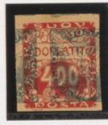
Bajo 2 h. (n o 1) periódicas