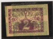
Sobre 104. (n.º 6)