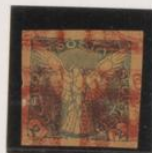
1/2 claro sobre 10h (n°5) doble impresion invertida