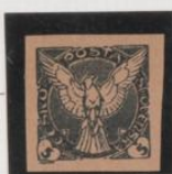
Doble impresión s/rosa "O" → "U"