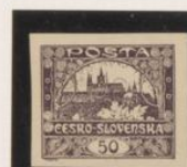
Borde de hoja