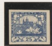
"S", palo horizontal corto