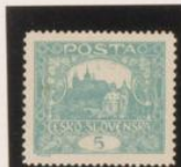
D. 13'15 x 11'5