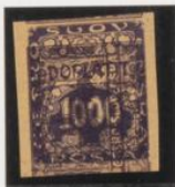
Sobre 5 h. (n o 1)