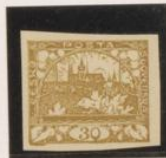
"0" de "30", vaído al marco