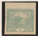
Papel fino hueso Doble marco superior