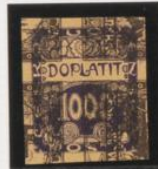
Sobre 1 h. (n o 1) ajustado