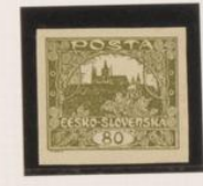
Falta línea inferior (marzo)