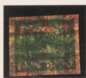
Doble impresión sobre 10h (n° 5), 2h (n° 3) de periódicos y 3h (n° 2)