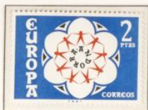
1973 — Europa