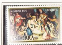
1975 — Navidad