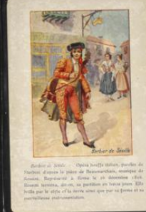
Héroïne de l'Église

Les Merveilles de la Nature - Opéra en 3 actes, paroles de Barthe, musique de Barbizet. Représenté à l'Opéra le 10 février 1814. Le sujet est emprunté à l'histoire de la nature et de l'Église. L'opéra est une œuvre de grande valeur artistique.