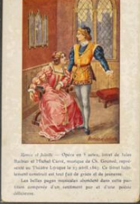
Les Merveilles de la Nature

Les Merveilles de la Nature - Opéra en 3 actes, paroles de Barthe, musique de Barbizet. Représenté à l'Opéra le 10 février 1814. Le sujet est emprunté à l'histoire de la nature et de l'Église. L'opéra est une œuvre de grande valeur artistique.