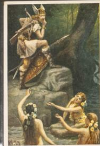
Bagdad und die Brestelshiden