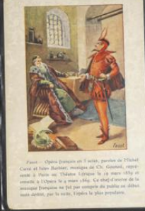
Héroïne de l'Église

Héroïne de l'Église - Opéra en 3 actes, paroles de Barthe, musique de Barbizet. Représenté à l'Opéra le 10 février 1814. Le sujet est emprunté à l'histoire de l'Église et de l'Église. L'opéra est une œuvre de grande valeur artistique.