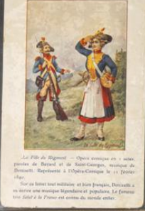
Les Merveilles de la Nature

Héroïne de l'Église - Opéra en 3 actes, paroles de Barthe, musique de Barbizet. Représenté à l'Opéra le 10 février 1814. Le sujet est emprunté à l'histoire de l'Église et de l'Église. L'opéra est une œuvre de grande valeur artistique.