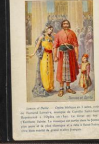
Héroïne de l'Église

Les Merveilles de la Nature - Opéra en 3 actes, paroles de Barthe, musique de Barbizet. Représenté à l'Opéra le 10 février 1814. Le sujet est emprunté à l'histoire de la nature et de l'Église. L'opéra est une œuvre de grande valeur artistique.