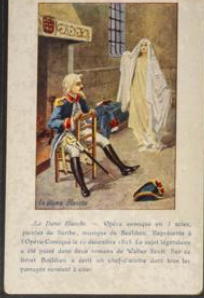
Le Drame de l'Église

Le Drame de l'Église - Opéra comique en 3 actes, paroles de Barthe, musique de Barbizet. Représenté à l'Opéra-Comique le 22 décembre 1813. Le sujet est emprunté à l'histoire de l'Église et de l'Église. L'opéra est une œuvre de grande valeur artistique.