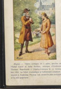
Héroïne de l'Église

Héroïne de l'Église - Opéra en 3 actes, paroles de Barthe, musique de Barbizet. Représenté à l'Opéra le 10 février 1814. Le sujet est emprunté à l'histoire de l'Église et de l'Église. L'opéra est une œuvre de grande valeur artistique.