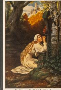
Tordisken - Den Guld de Trælshid