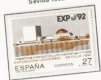
1992 - Exposición Universal Sevilla 1992