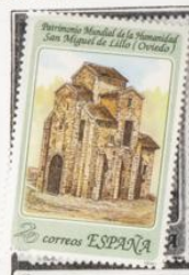
Iglesia prerrománica. S. Miguel de Lillo. Oviedo.