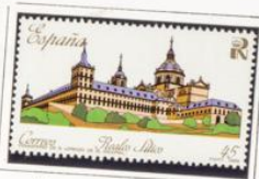
Palacio Real de Aranjuez.