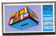
Urna electoral y Bandera.