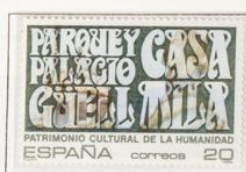
Parque y Palacio de Güell y Casa Milà. Barcelona.