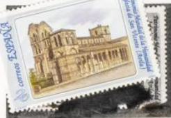
Casco viejo de Avila. Iglesias de extramuros. San Vicente (Avila).