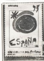
Símbolo del turismo, creado por Joan Miró