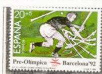
Hockey sobre hielo.