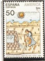
Ilustración del manuscrito: "Nueva crónica y buen gobierno".

1989.-América-UPAE. Pueblos precolombinos.