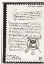
1º Convenio Internacional y escudo