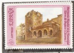
Centro histórico de Cáceres. Torre de Bujaco.