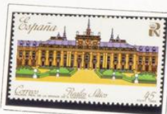
Monasterio de San Lorenzo del Escorial.