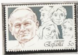
El Papa y grupo de jóvenes.

1989.-Barcelona'92. III Seria Pre-Olimpica.