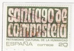
Ciudad de Santiago de Compostela. La Coruña.