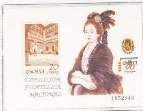
Patio de la Infanta e imagen de la infanta Mª.Teresa Villabriga, según Goya.

1990.-Exposición Filatélica Nacional,Exfilna '90 en Zaragoza.