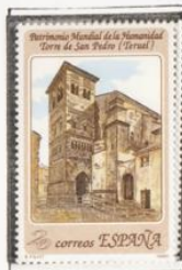
Arquitectura mudéjar de Teruel. Torre de San Pedro.