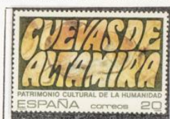
Cuevas de Altamira. Santander.