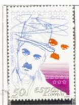
Charlie Chaplin. Charlot.