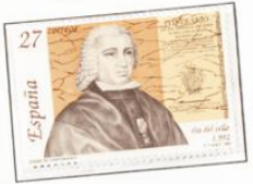
1992 - Día del Sello