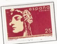
1992 - Margarita Xirgu