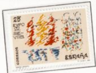
1992 - Diseño infantil