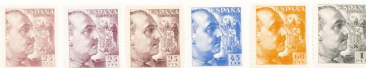
(Lugar 13 del bloque reporte)