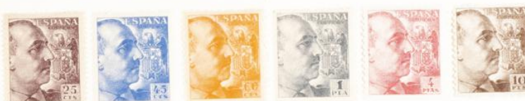
(Lugar 24 del bloque reporte)