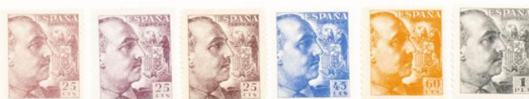
(Lugar 13 del bloque reporte)