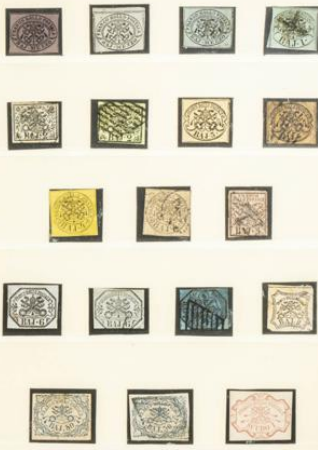
ESTADOS DE LA IGLESIA