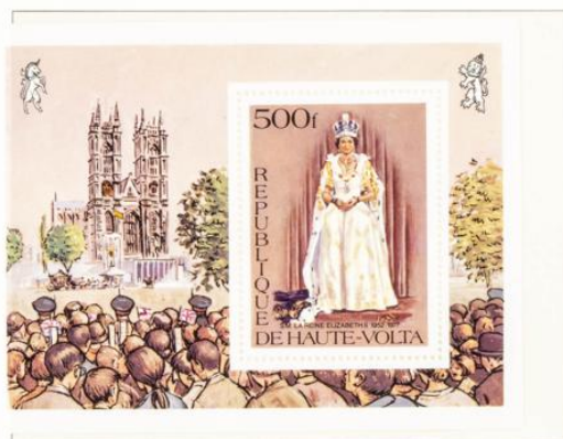
Die Königin im Staatsgewand aus reiner Seide, mit Staatskrone, dazu Hermelin- umhang; aus der Serie Königsfotos 1953 nach Dorothy Wilding. Auf dem Blockrand die Menschenmenge beim Krönungsumzug; hinten die Krönungskutsche. Vor der Abtei ist der Annex zu sehen, oben links und rechts die Wappentiere — Einhorn und Löwe.