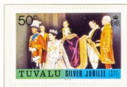
Die Königin bei der Krönung.