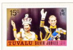
Königin Elisabeth II. und der Herzog von Edinburgh auf dem Balkon vom Buckingham-Palast nach der Krönung.

Kronkolonie im Stillen Ozean, ehem. Ellice-Inseln, seit 1976 von Gilbert-Inselgruppe unabhängig; Hauptort: Funafuti; 10 000 Einw.; Wäbrg.: 1 Austr.-Dollar = 100 Cents.