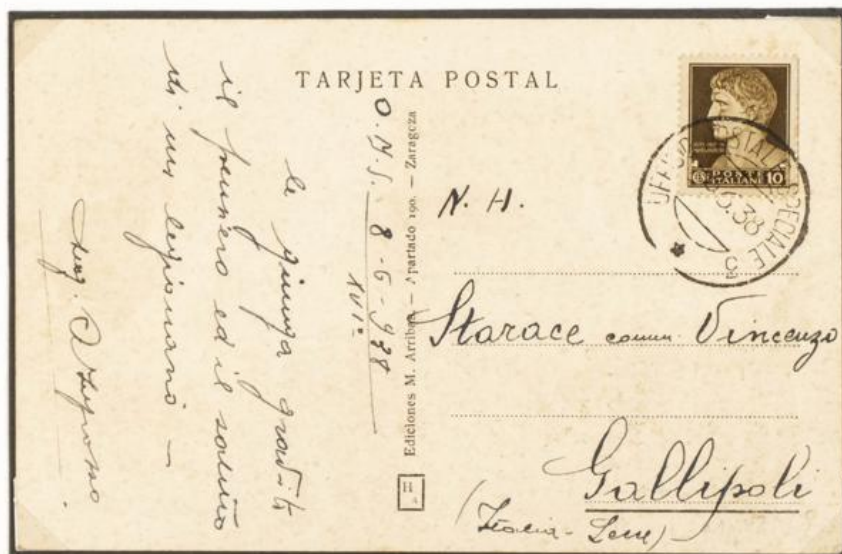
Départ de l'office postal 3, le 8/6/1938 vers GALLIPOLI.