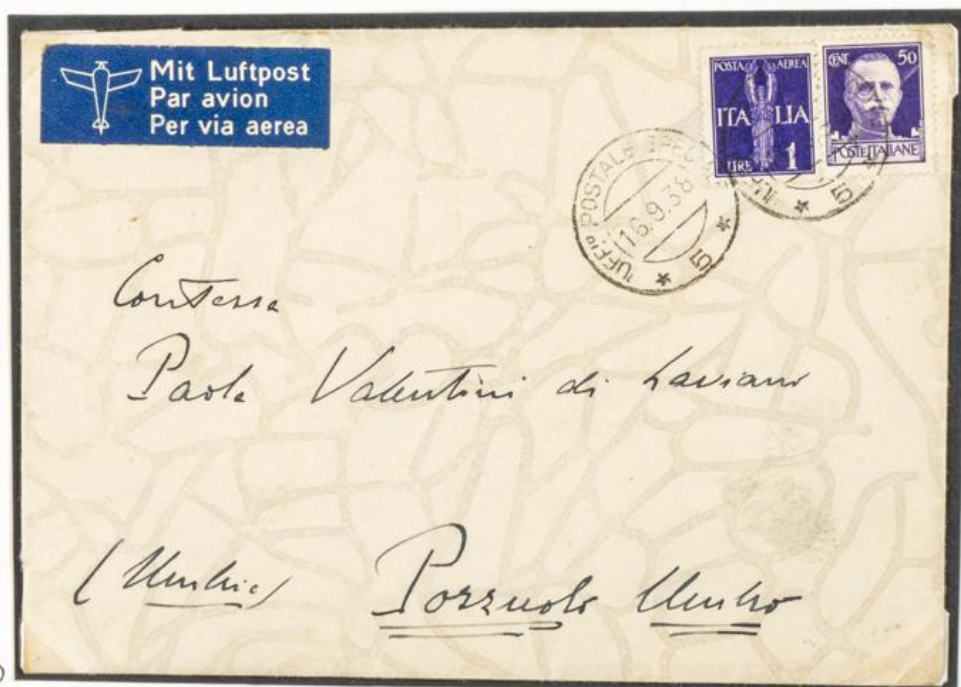
Départ le 16/9/1938 del'office postal 5.