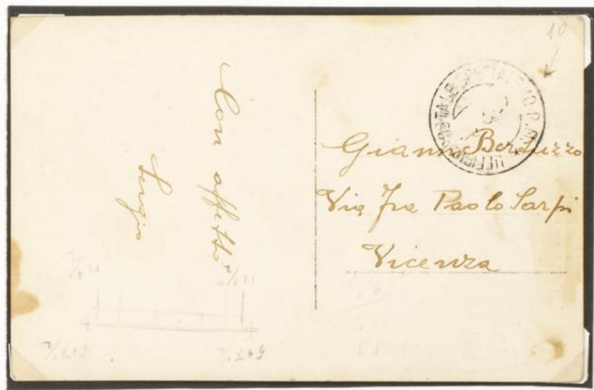
Départ de l'office postal 10. Date illisible de 1937.