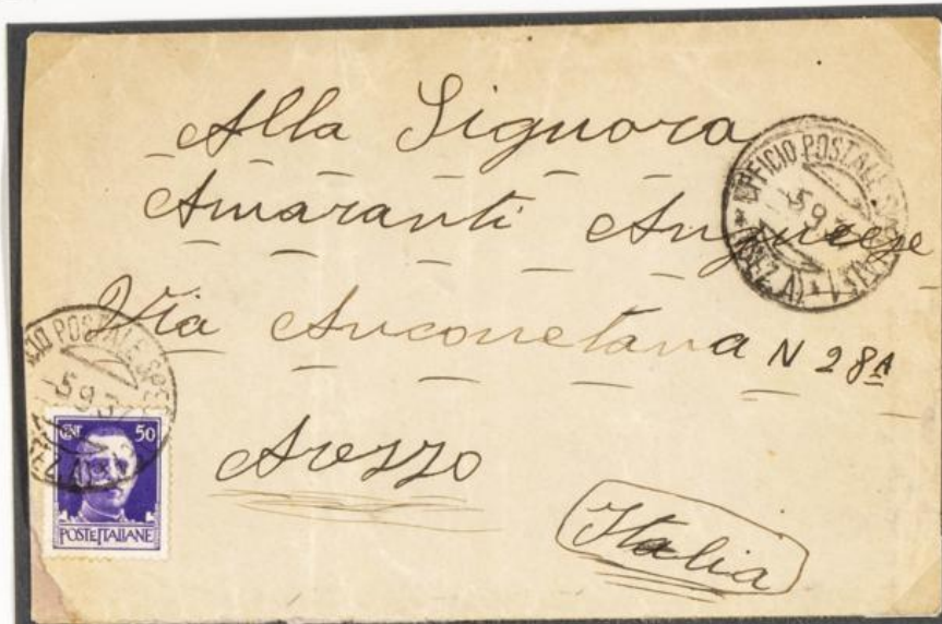
Départ le 5/9/1937 de l'office postal militaire 1 sect.A.