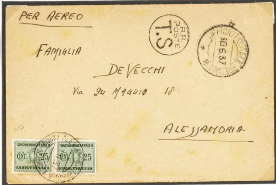
Départ de l'office postal 8, le 10/6/1937.