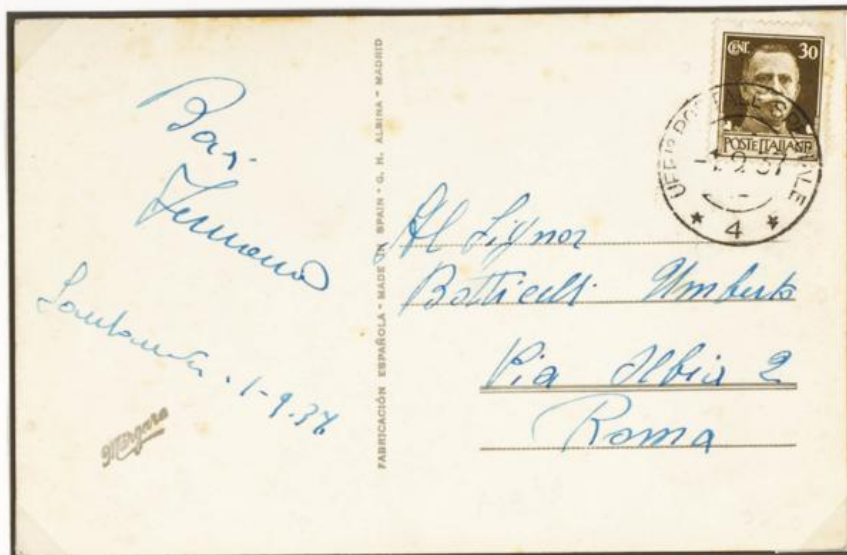
Départ de l'office postal 4 , le 1/9/1937 vers ROME.