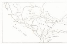
MAPA DE LAS RUTAS DE LOS CORREOS MARÍTIMOS DEL ESTADO ALREDEDOR DE 1776

En los primeros tiempos las comunicaciones postales entre España y sus colonias de América fueron muy escasas y servidas por los Correos Mayores, se limitaban a los documentos oficiales y a los de un solo poder notarial y personal, aprovechando las travesías de los buques que cruzando el océano, transportaban en uno y otro sentido, mercancías, tropas, colonos y el oro y la plata amonedaados en las caicas de las Américas.