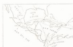
MAPA DE LAS RUTAS DE LOS CORREOS MARÍTIMOS DEL SIGLO XVII