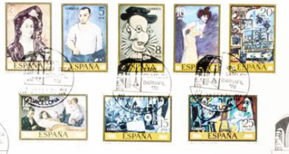
Motivos especiales de Barnat676