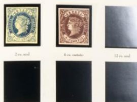
2 c. azul 4 c. carterado 12 c. azul 10 c. rosa 1 c. carterado 2 c. verde

El valor de 4 cuartos de esta serie, se emitió el día 16.7.1862 y los demás valores el día 1.8.1862. De nuevo, debido a la aparición de falsos postales, el valor de 4 cuartos fue retirado de la circulación el día 31.12.1863, mientras que el resto de valores continuó en vigencia hasta el 20.2.1864. El papel utilizado para su confección fue el colorado, que variaba según los valores a imprimir. Se conocen variedades de papel, color y de impresión. Los signos de identificación de esta serie son los siguientes: en la parte superior derecha, la línea que sale de la peña encima de la separación, existente entre la A y la N, está rota. La primera línea de sombra, comienza así en la mitad de la barbilla, se curva y se dirige hacia abajo y, finalmente, las colas de los leones están casi juntas o se tocan. Los matasellos más utilizados en esta emisión fueron los de rueda de carreta y comenzó a usarse a principios de 1863 el matasello de pañeta con cifra. También se conocen fechadores, matasellos de ambulante y de rejilla.