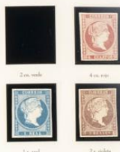
2 c. verde 4 c. rojo 1 c. azul 2 c. violeta

En esta serie se utilizaron distintas clases de papel sin filigrano, se pueden encontrar sellos en un papel fino y grueso, grueso y delgado, variando también la tonalidad. Se conocen variedades de color y de impresión, así como diversas falsificaciones. A finales del año 1858 comenzó a circular un nuevo matasello, llamado «cruza de carreta» que mostraba el escudo de la Administración postal o estafeta. Normalmente es de color negro, pero también existe en color azul. Además de este se utilizaron matasellos de fecha, grande y pequeño, muchos y todos ellos en diversos colores: negro, azul, rojo, verde y violeta.