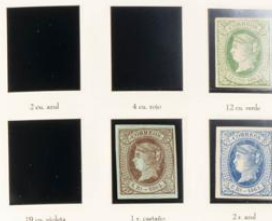
2 c. azul 4 c. rojo 12 c. verde 19 c. violeta 1 c. castaño 2 c. azul

Según indica la legislación oficial esta serie se emitió en dos fechas, aproximándose primero al millo de 4 cuartos (1.1.1864) y posteriormente al resto de valores (1.3.1864). Se realizó en papel colorado, distinto para cada valor de la emisión. Se conocen variedades de color, de papel y de impresión. Existen dos valores de la serie dentado: 4 cuartos (dentado 13) y 2 cuartos (dentado 14). Las marcas de identificación son las siguientes: las dos últimas letras de la dactiloma se encuentran casi pegadas. En las cuatro esquinas hay unas estrellas sombreadas, estrellas que no se encuentran en las falsificaciones. Como en la serie anterior al matasello más frecuente fue el de rueda de correo. También se utilizaron matasellos de rejilla, parrilla, matasello de fecha y matasello ambulante.