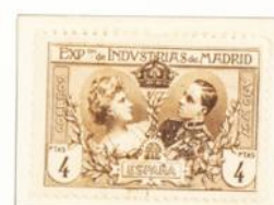
1911-20. Giro postal - Dent. 13', (Serie 61)