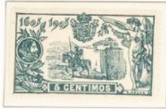
1905. Eligie de Cervantes y escenas del Quijote - Dent. 14 (Serie 58)