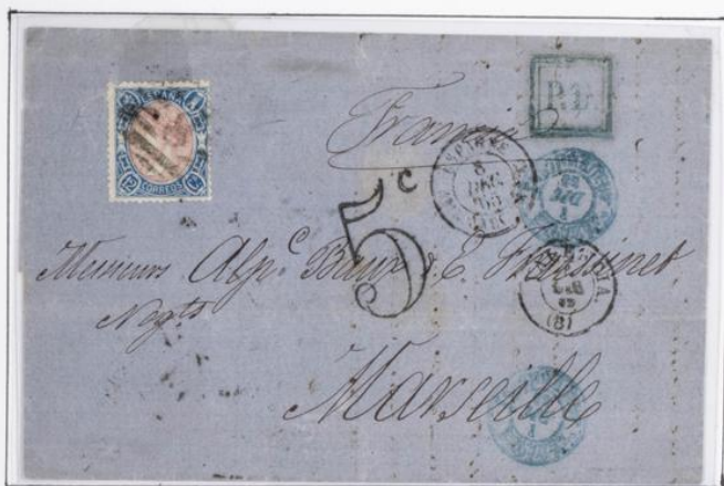
Sobrescrito de Valencia a Marsella. 6 mit. en el frente y 2 en el reverso para.