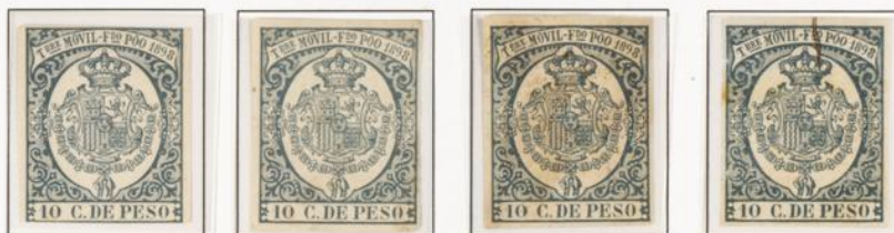
1899.- Timbre móvil de Fernando Poo año 1898. Sobrecargado para 1899.