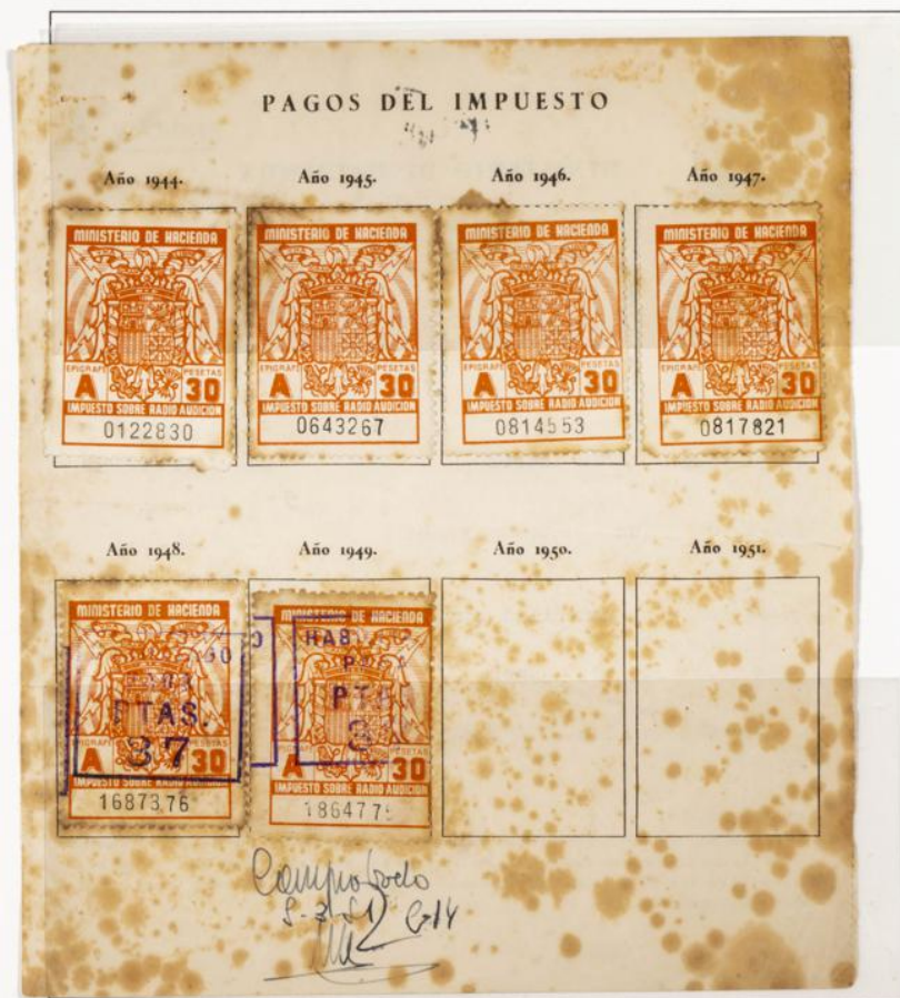
Impuesto sobre Radioaudición. Documento fechado el 1 de Enero de 1944. Contiene cuatro sellos de 30 Pts serie A de los años 1944 al 47 y dos de 30 Pts. Habilitados para 37 Pts. para los años 1948 y 49