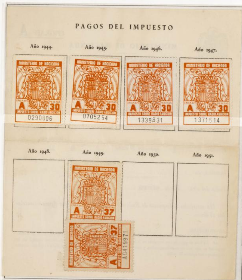
Impuesto sobre la Radioaudición. Documento fechado el 20 de Enero de 1944. Contiene cuatro sellos de 30 Ptas años 1944 al 1947 y dos de 37 Ptas correspondientes al año 1949 y al pago no satisfecho de 1948. En el dorso del sello correspondiente a 1948 figura la fecha escrita a mano.