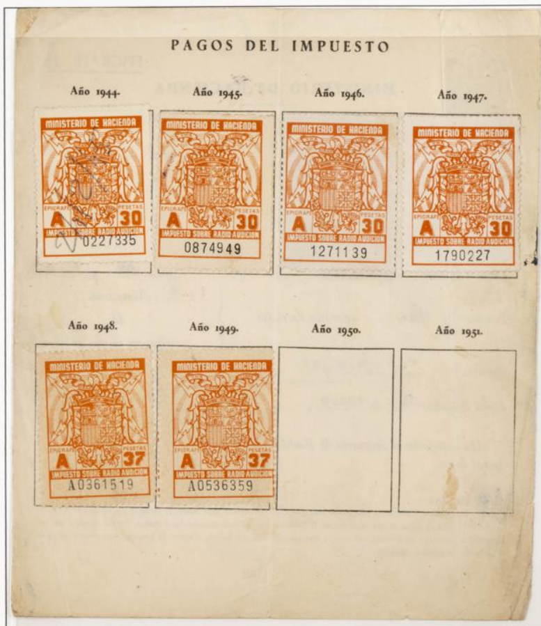
Impuesto sobre Radioaudición. Documento fechado el 31 Enero de 1944. Contiene cuatro sellos de 30 Pts serie A de los años 1944 al 47 y dos de 37 Pts. para el año 1948 y 49