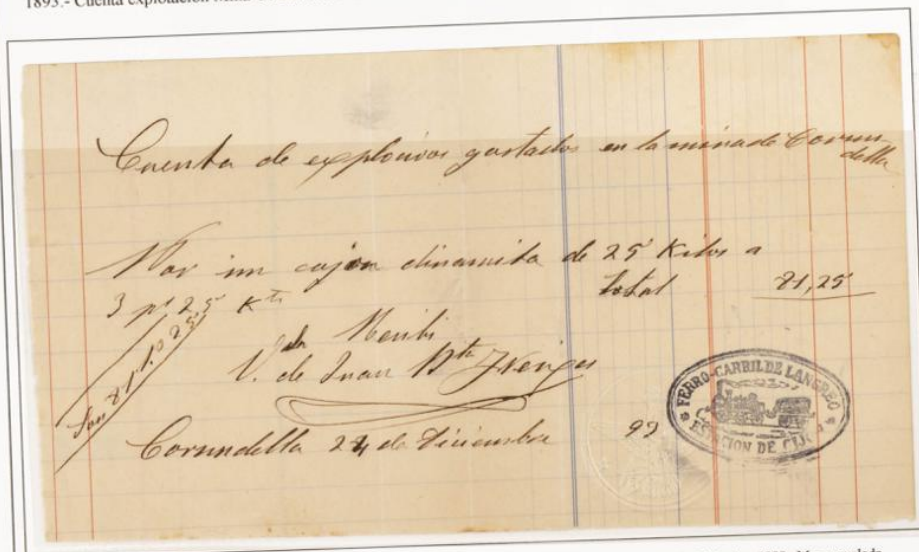
Cuenta de explotación y gastos en la mina Corundella. Por un cajón de dinamita de 29 Kilos. Corundella 24 de Diciembre 1889. Marca ovalada Ferrocarriles de Langreo, estación de Gijón.

1893 - Cuenta explotación Mina Corundella. Ferrocarril de Langreo.