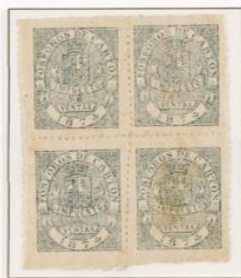
Bloque de cuatro dentado azul

Los sellos se confeccionaron a este fin fueron rectangulares teniendo en el centro el escudo de España de los sellos anteriores, en la parte superior dentro de medio ovalo, las palabras fósforo de cartón y en la inferior en cuatro líneas impuesto de ventas 1874. Son litografiados y no se dentaron las hojas.