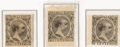
Error en la R