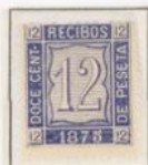
Estudio sobre tonalidades de color y papel.