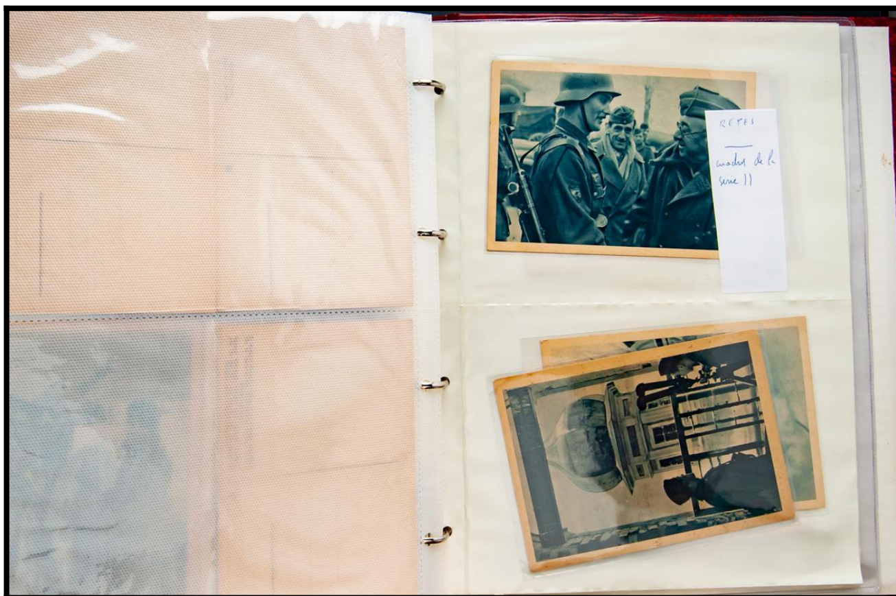
RETES — marchés de la zone II