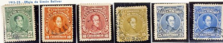
1915-23.—Efigie de Simón Bolívar