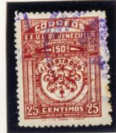
Entrada de Bolívar