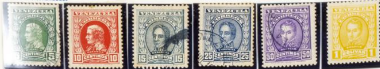
Francisco de Miranda