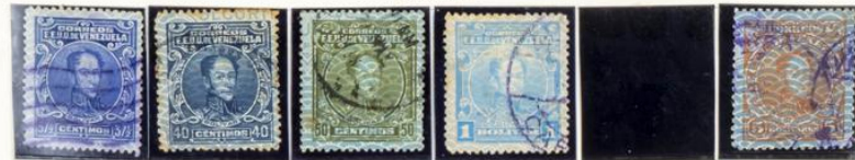
1933-36.- Sellos de 1924-32 habilitados con 1933 y nuevo valor