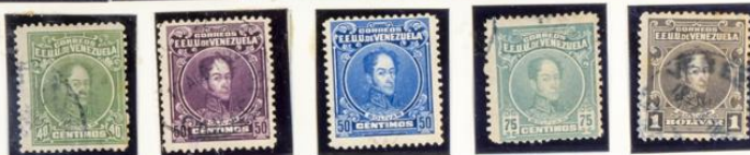
1924-28.—Sellos de 1915-23 con los colores cambiados