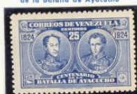
Simón Bolívar y A. J. de Sucre