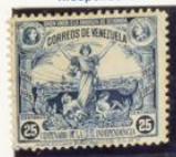
Vista de Caracas y Libertad