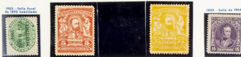
1903.- Sello fiscal de 1893 habilitado