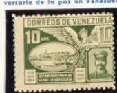
General Gómez y vista de Ciudad Bolívar