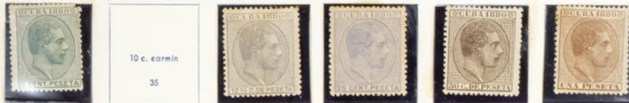
1880.—Efigie e inscripción «CUBA 1880»