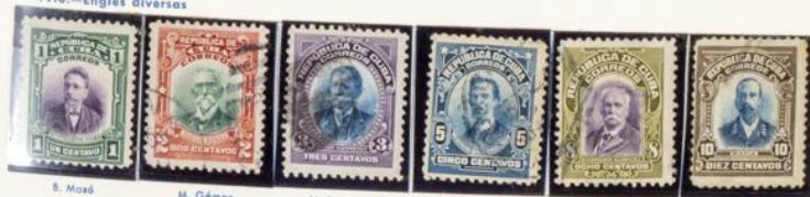
B. Masó M. Gómez V. Sanguily I. Agramonte C. García Martí Rodríguez