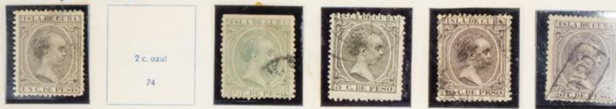
1890.—Efigie de Alfonso XIII