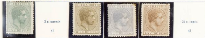
1881.—Efigie e inscripción «CUBA 1881»