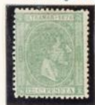
1876.—Efigie e Inscripción «Ultramar 1876»