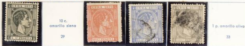
1879.—Efigie e inscripción «CUBA 1879»