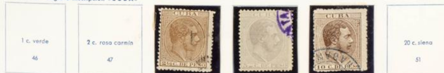
1882-84.—Efigie e inscripción «CUBA»