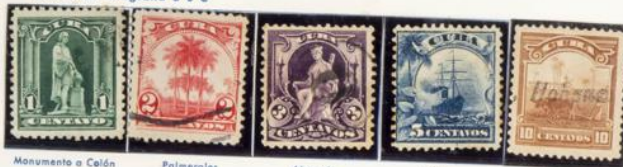
Monumento a Colón Palmerales Alegoría Vapor Ingenio