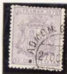
1875.—Escudo mural de España