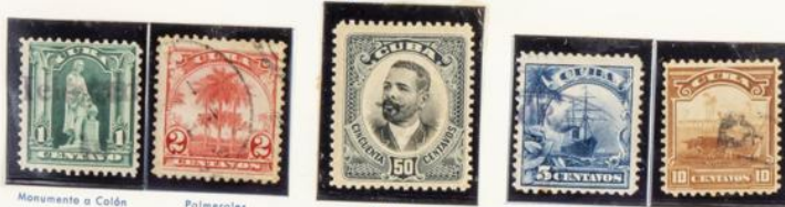
Monumento a Colón Palmerales A. Maceo Buque Ingenio

1905.—Sellos de 1899-1902 retocados. Sin filigrana