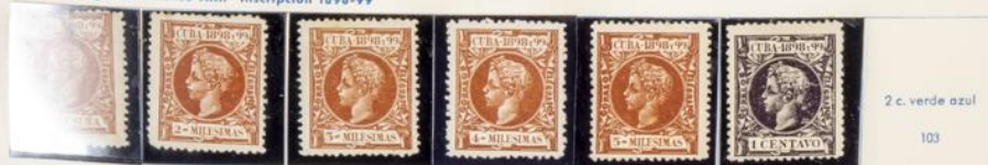
1898.—Efigie de Alfonso XIII. Inscrpción 1898-99

40 c. siena amarilla 95 80 c. violeta obscuro 96