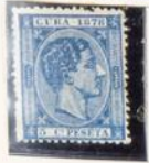
1878.—Efigie e Inscripción «CUBA 1878»