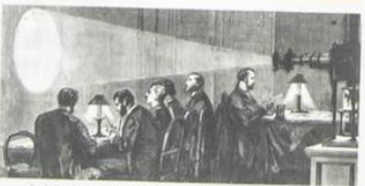
In 1870 during the Franco-Prussian War, the Siege of Paris cut communications for The Times. Above: dispatches and personal advertisements for the Agency Column were flown out by balloons. Below: microscopically reduced messages were carried in and out by pigeons, and magnified by electric light