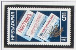
1987. Aniversario de los periódicos «Ragotnh'b», «Ragotnyeckn Bebtchk'b» y «Ragotnhnyeko Alao»