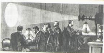
In 1870 during the Franco-Prussian War, the Siege of Paris cut communications for The Times. Above: dispatches and personal advertisements for the Agency Column were flown out by balloons. Below: microscopically reduced messages were carried in and out by pigeons, and magnified by electric light