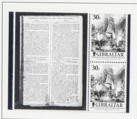
Batalla de Trafalgar, 1805

2001. Bicentenario del diario «Gibraltar Chronicle». Sellos alusivos a acontecimientos importantes y viñetas de las primeras páginas de los números de esos días