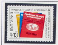
1988. Revista «Problemas de la paz». 30 aniversario