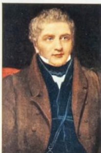
John Walter II was the founding father of the role of the press as a fourth estate of the realm. His great editor was the young Thomas Barnes. The Lord Chancellor said: "Barnes is the most powerful man in the country"