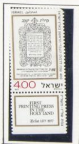
1977. Cuarto centenario del primer periódico israelí impreso en Tierra Santa