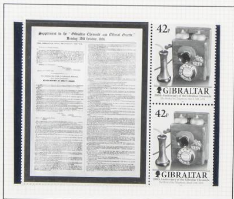
Nacimiento del teléfono, 1876