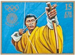
འབྲུག་ BHUTAN • འབྲུག་