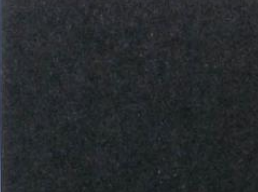
འབྲུག་ BHUTAN • འབྲུག་