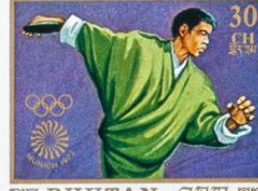
འབྲུག་ BHUTAN • འབྲུག་