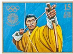
འབྲུག་ BHUTAN • འབྲུག་