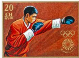
འབྲུག་ BHUTAN · འབྲུག་