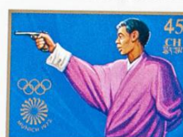
འབྲུག་ འབྲུག་ འབྲུག་