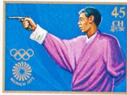
འབྲུག་ འབྲུག་ འབྲུག་