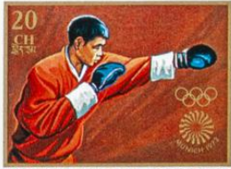
འབྲུག་ BHUTAN · འབྲུག་