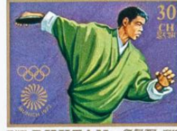
འབྲུག་ BHUTAN • འབྲུག་