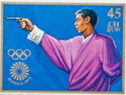
འབྲུག་ འབྲུག་ འབྲུག་