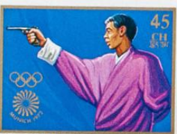
འབྲུག་ འབྲུག་ འབྲུག་