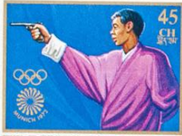
འབྲུག་ འབྲུག་ འབྲུག་