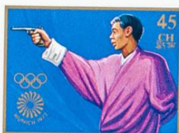
འབྲུག་ འབྲུག་ འབྲུག་