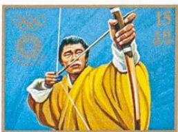
འབྲུག་ BHUTAN • འབྲུག་