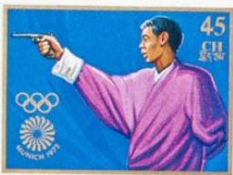
འབྲུག་ འབྲུག་ འབྲུག་