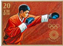
འབྲུག་ BHUTAN · འབྲུག་