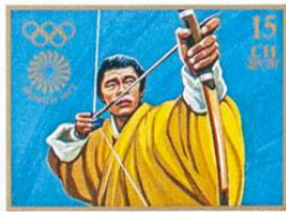
འབྲུག་ BHUTAN • འབྲུག་