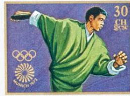
འབྲུག་ BHUTAN • འབྲུག་