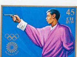
འབྲུག་ འབྲུག་ འབྲུག་