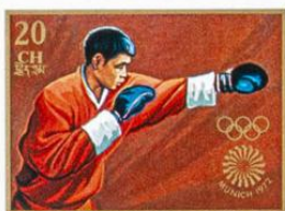
འབྲུག་ BHUTAN · འབྲུག་