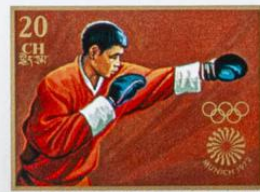
འབྲུག་ BHUTAN · འབྲུག་