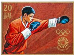
འབྲུག་ BHUTAN · འབྲུག་