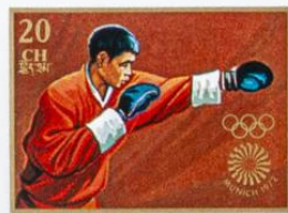
འབྲུག་ BHUTAN · འབྲུག་