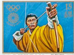
འབྲུག་ BHUTAN • འབྲུག་