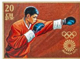
འབྲུག་ BHUTAN · འབྲུག་