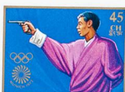
འབྲུག་ འབྲུག་ འབྲུག་