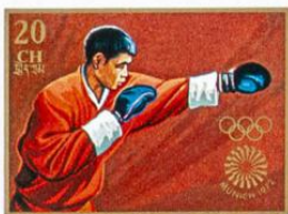
འབྲུག་ BHUTAN · འབྲུག་