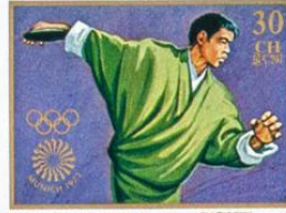
འབྲུག་ BHUTAN • འབྲུག་