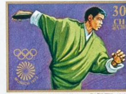
འབྲུག་ BHUTAN • འབྲུག་