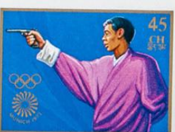
འབྲུག་ འབྲུག་ འབྲུག་