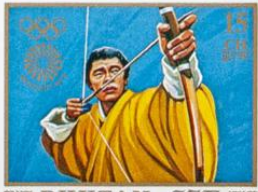
འབྲུག་ BHUTAN • འབྲུག་