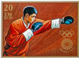
འབྲུག་ BHUTAN · འབྲུག་