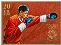
འབྲུག་ BHUTAN · འབྲུག་