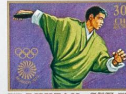
འབྲུག་ BHUTAN • འབྲུག་