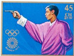
འབྲུག་ འབྲུག་ འབྲུག་