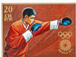
འབྲུག་ BHUTAN · འབྲུག་