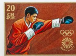
འབྲུག་ BHUTAN · འབྲུག་