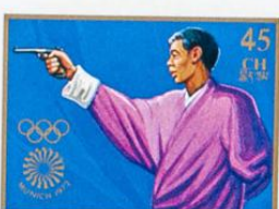
འབྲུག་ འབྲུག་ འབྲུག་