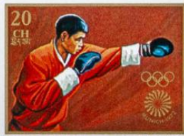
འབྲུག་ BHUTAN · འབྲུག་