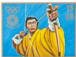
འབྲུག་ BHUTAN • འབྲུག་