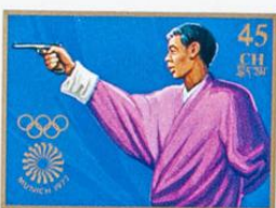
འབྲུག་ འབྲུག་ འབྲུག་