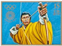
འབྲུག་ BHUTAN • འབྲུག་