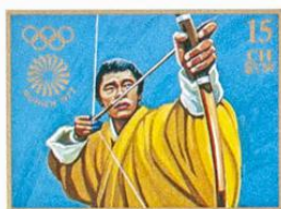
འབྲུག་ BHUTAN • འབྲུག་