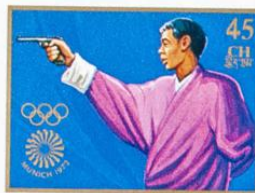
འབྲུག་ འབྲུག་ འབྲུག་