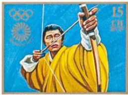
འབྲུག་ BHUTAN • འབྲུག་