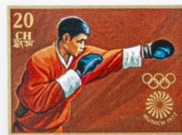
འབྲུག་ BHUTAN · འབྲུག་