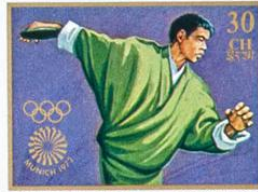
འབྲུག་ BHUTAN • འབྲུག་