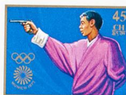
འབྲུག་ འབྲུག་ འབྲུག་