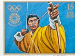
འབྲུག་ BHUTAN • འབྲུག་