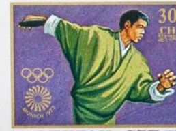
འབྲུག་ BHUTAN • འབྲུག་