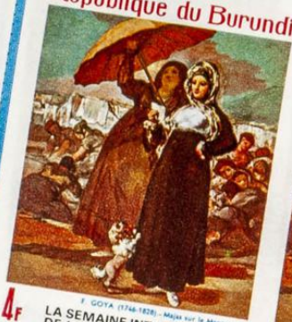
4f F. GOYA (1746-1828) - Majas sur le Manzanares. LA SEMAINE INTERNATIONALE DE LA LETTRE ÉCRITE - 1968 -