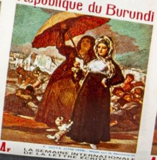
4f F. GOYA (1746-1828) - Majas sur le Manzanares. LA SEMAINE INTERNATIONALE DE LA LETTRE ÉCRITE - 1968 -