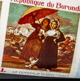
4f F. GOYA (1746-1828) - Majas sur le Manzanares. LA SEMAINE INTERNATIONALE DE LA LETTRE ÉCRITE - 1968 -