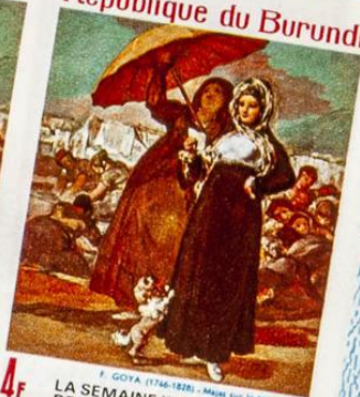
4f F. GOYA (1746-1828) - Majas sur le Manzanares. LA SEMAINE INTERNATIONALE DE LA LETTRE ÉCRITE - 1968 -