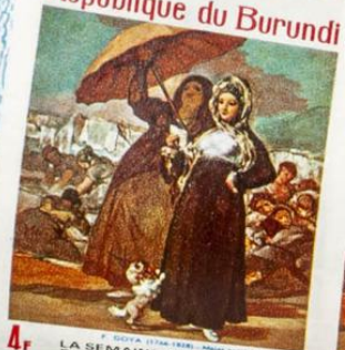
4f F. GOYA (1746-1828) - Majas sur le Manzanares. LA SEMAINE INTERNATIONALE DE LA LETTRE ÉCRITE - 1968 -