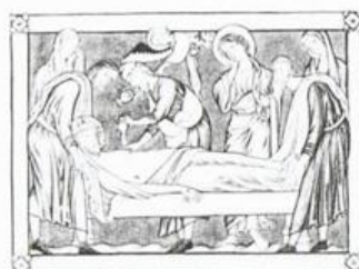
ISUS IS PUT INTO SEPULCHRE 1 AJMAN عجمان Ri AIR MAIL ريل ارشيديوي