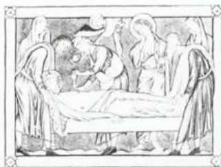
ISUS IS PUT INTO SEPULCHRE 1 AJMAN عجمان Ri AIR MAIL ريل ارشيديوي