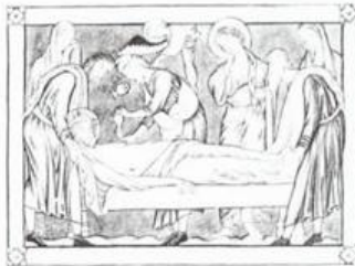
ISUS IS PUT INTO SEPULCHRE 1 AJMAN عجمان Ri AIR MAIL ريل ارشيديوي