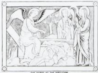
THE MARES AT THE SEPULCHRE 2 AJMAN عجمان Ri AIR MAIL ريل ارشيديوي