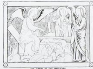
THE MARES AT THE SEPULCHRE 2 AJMAN عجمان Ri AIR MAIL ريل ارشيديوي