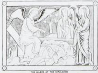
THE MARES AT THE SEPULCHRE 2 AJMAN عجمان Ri AIR MAIL ريل ارشيديوي