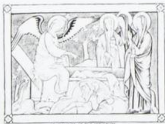
THE MARES AT THE SEPULCHRE 2 AJMAN عجمان Ri AIR MAIL ريل ارشيديوي