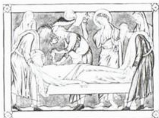
ISUS IS PUT INTO SEPULCHRE 1 AJMAN عجمان Ri AIR MAIL ريل ارشيديوي