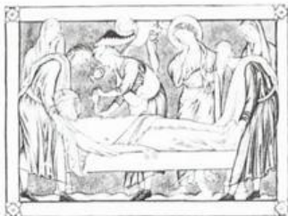
ISUS IS PUT INTO SEPULCHRE 1 AJMAN عجمان Ri AIR MAIL ريل ارشيديوي