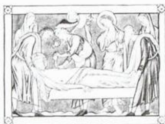
ISUS IS PUT INTO SEPULCHRE 1 AJMAN عجمان Ri AIR MAIL ريل ارشيديوي