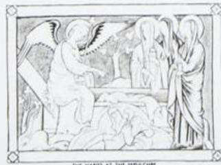
THE MARES AT THE SEPULCHRE 2 AJMAN عجمان Ri AIR MAIL ريل ارشيديوي