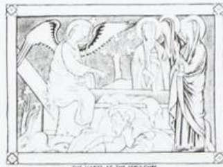
THE MARES AT THE SEPULCHRE 2 AJMAN عجمان Ri AIR MAIL ريل ارشيديوي