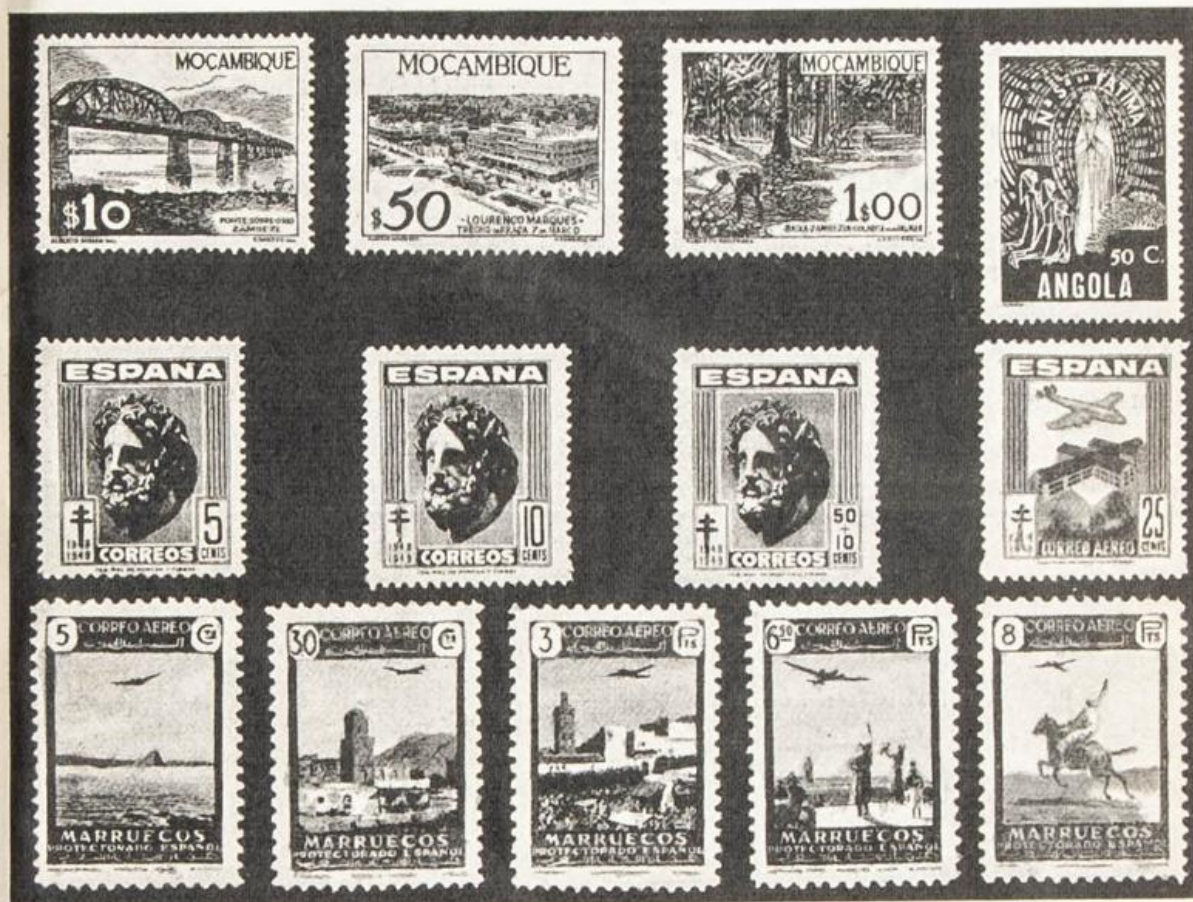
Ultimas emisiones de Colonias Portuguesas, España y Marruecos