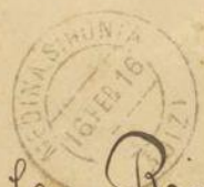
CARTA DE MEDINA SIDONIA EL 16 FEB. 1916 A MADRID CON LA FRANQUICIA EN VIOLETA