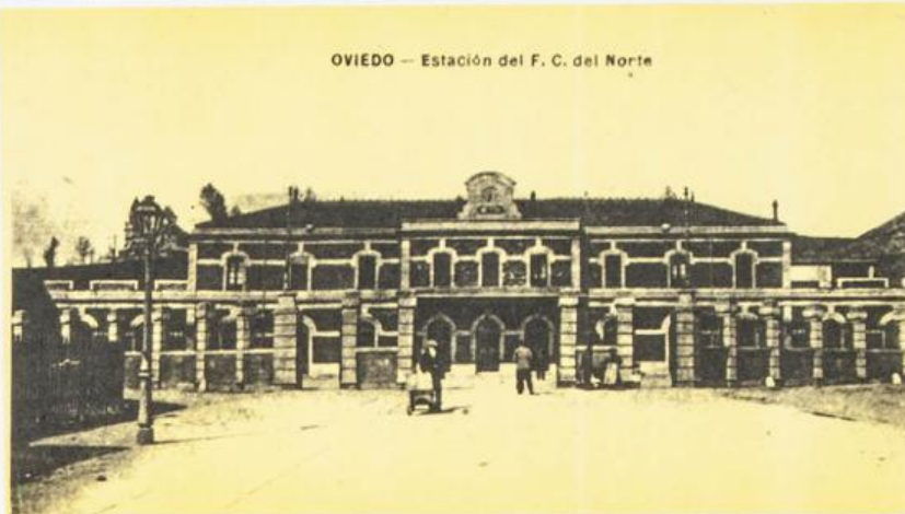
OVIEDO — Estación del F. C. del Norte